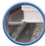
Kit 600x400 en option