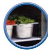
Grilles sur glissières