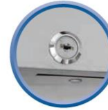
Serrure de porte